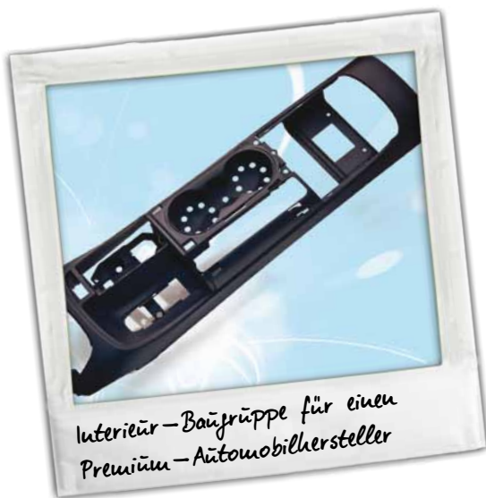
Formpool entwickelt Baugruppen, Prototypen und Serienwerkzeuge u.a. für den Automotive-Bereich.

Anbindung von Unternehmen mit leistungsfähigen Glasfaseranschlüssen für eine optimale und zukunftssichere Telekommunikationsanbindung